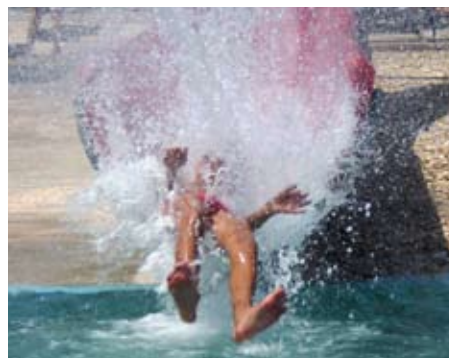
Das kommt raus, wenn man das Warnschild tunlichst ignoriert...