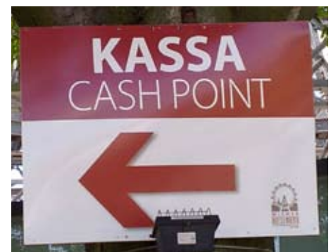
Linguistische Verwirrung: Bekommt man hier Geld oder muss man welches ausgeben? Gesehen beim Riesenrad im Wiener Prater