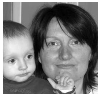
ingrid.haussteiner@ utanet.at ist Vorsitzende des Übersetzerausschusses

Der ÜA wird sich in den nächsten Monaten mit den Prioritätsbereichen auseinandersetzen. Anregungen und Hinweise sind willkommen. Falls Sie aktiv an diesem Thema mitarbeiten möchten, dann melden Sie sich bitte (vor allem, wenn Sie kein Universitas-Mailbox-Mitglied sind).