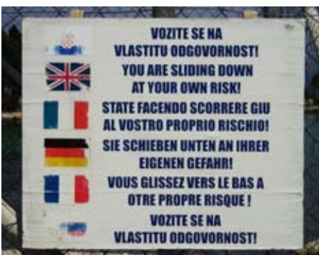
Die Verbote an dieser kroatischen Wasserrutsche haben sich gewaschen, fand Vera Ribarich