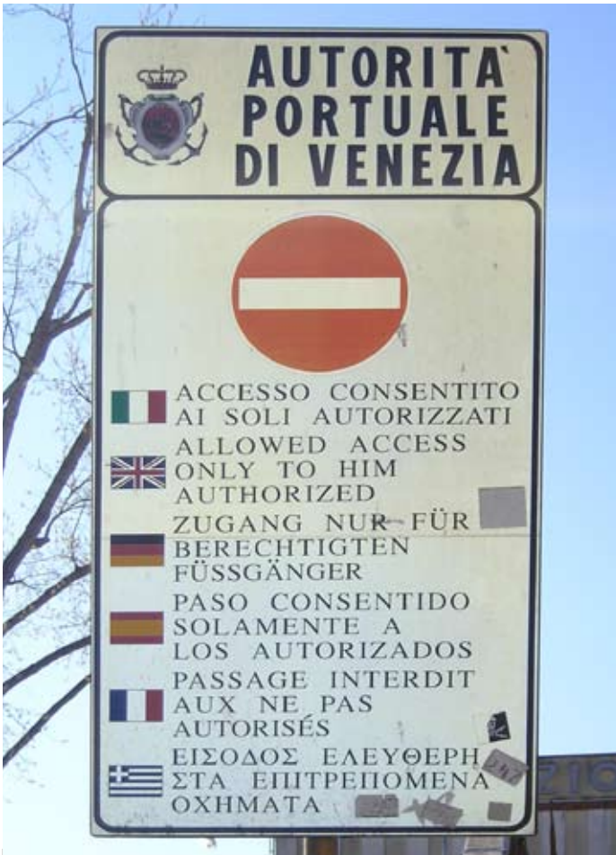
Umlaut-Überfall in Venedig, gesehen von Vera Ribarich